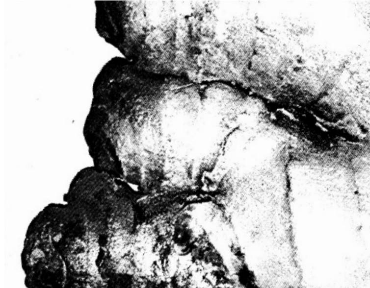
Bières/Vins +16 ans, Alcools forts/Spiritueux +18 ans